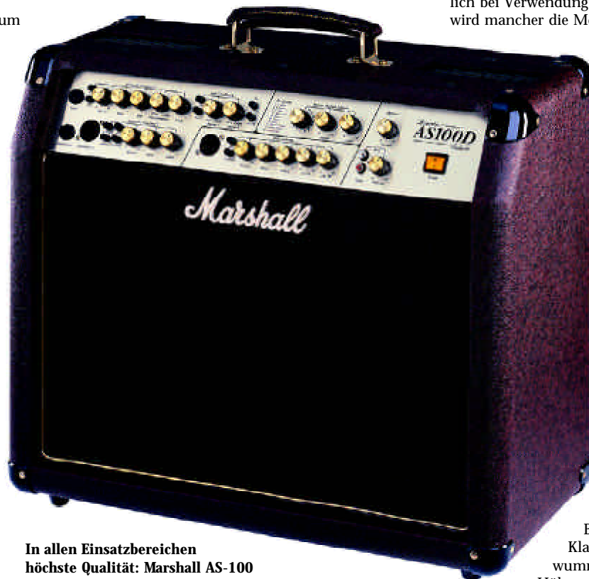
In allen Einsatzbereichen höchste Qualität: Marshall AS-100

Die Anschlussoptionen lassen erkennen, dass der AS-100 unterschiedlichsten Einsatzbereichen auf professionelle Art gerecht werden soll. Die Verstärkung von Kombi-Pickup-Systemen (Piezo- plus Magnetton-Abnehmer oder Mikrofon), gleichzeitiger Einsatz von Gitarre und Gesang, Solo-Auftritt mit Sequencer/Drum-Computer, luxuriöses Monitoring in der Band – all dies ist möglich. Dennoch ist der AS-100 einfach zu bedienen. Der erste Kanal („Acoustic Channel 1“) ist ausschließlich für den Anschluss einer Gitarre konzipiert und bietet mit der